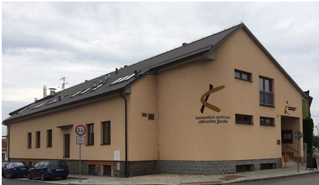
Budova Komunitního centra aktivního života